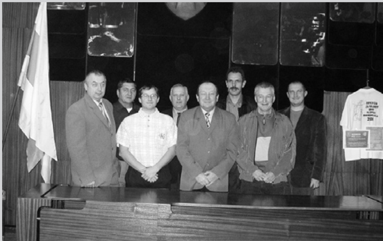
Zastupiteľstvo v rokoch 2003-2006

Za aktívnu činnosť obecného zastupiteľstva ďakujeme všetkým poslancom ako aj členom komisií