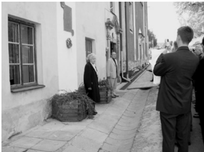
Slovenská Baňa -Štiavnické Bane, 13.október 2006