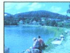
letná turistická sezóna

Verím, že obec urobila všetko preto, aby sa v našej obci Štiavnické Bane obyvatelia a návštevníci dobre cítili.