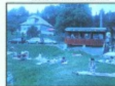
letná turistická sezóna